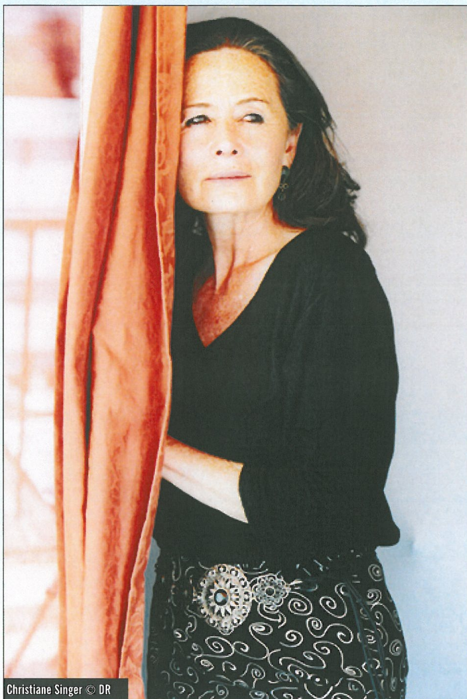
Christiane Singer

le début de la guerre. Son père est juif. Ils ont quitté l'Autriche. Ils viennent d'arriver à Marseille. Ils s'interrogent sur le fait d'accueillir ou non l'enfant que la maman porte en elle. Soudain, dans la salle d'attente du médecin, son père prend la main de sa femme et lui dit : « Ce n'est pas à nous de faire l'œuvre de l'ennemi »... Ils partirent sur le champ et « me voilà »